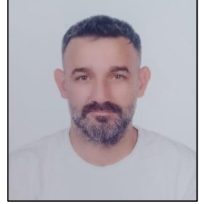
CAN ŞAGAR YÖNETİM KURULU ÜYESİ